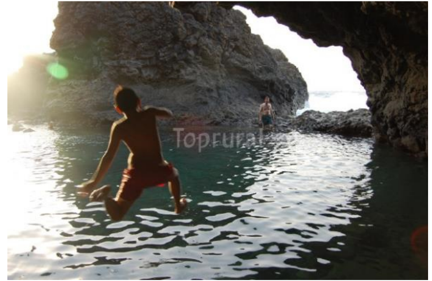
Playa El Verodal (Frontera)